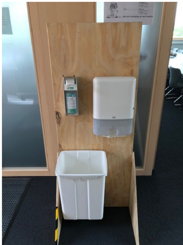
Hygienestation vor dem Lehrerzimmer