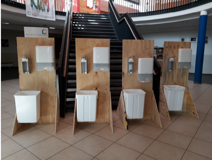
Hygienestationen im Untergeschoss